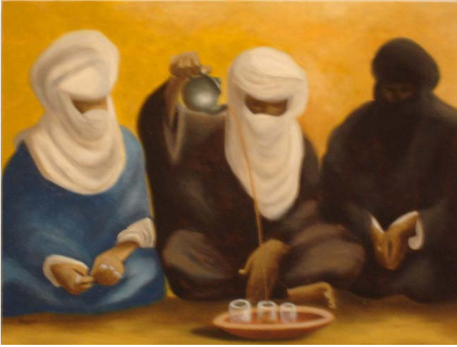
"La bevanda del deserto" olio su tela cm 30x40