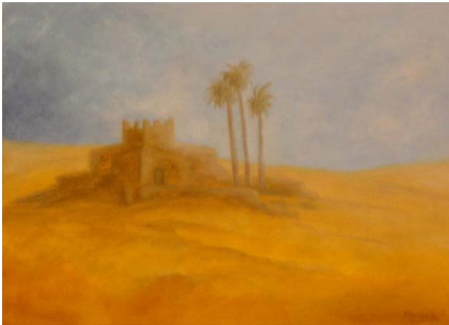
"Il silenzio" olio su tela cm 25x35

(in prima pagina) "In ascolto del vento" olio su tela cm 18x50